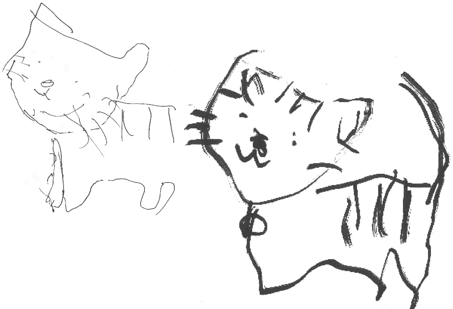
ねこのおやこ 絵：きーちゃん (奏海の杜)