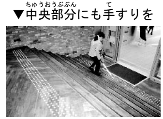
▼中央部分にも手すりを 直前にいきなり点字ブロック が出てくる ので、階段 までの誘導 ブロックが 必要だと思 いました。